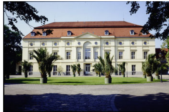
Neue Adresse für das Käthe-Kollwitz-Museum: der Theaterbau des Schlosses Charlottenburg.

Die offene Standortfrage des Berliner Käthe-Kollwitz-Museums ist entschieden! Das Museum wird 2022 in den repräsentativen Theaterbau des Schlosses Charlottenburg ziehen. Ein entsprechender Mietvertrag wurde mit der Stiftung Preußische Schlösser und Gärten Berlin-Brandenburg (SPSG) zum 1. April 2022 abgeschlossen. Ab Sommer 2022 wird sich das Käthe-Kollwitz-Museum in dem dreigeschossigen frühklassizistischen Gebäude präsentieren, das nach Plänen von Carl Gotthard Langhans (1732-1808), dem Architekten des Brandenburger Tores, errichtet wurde.